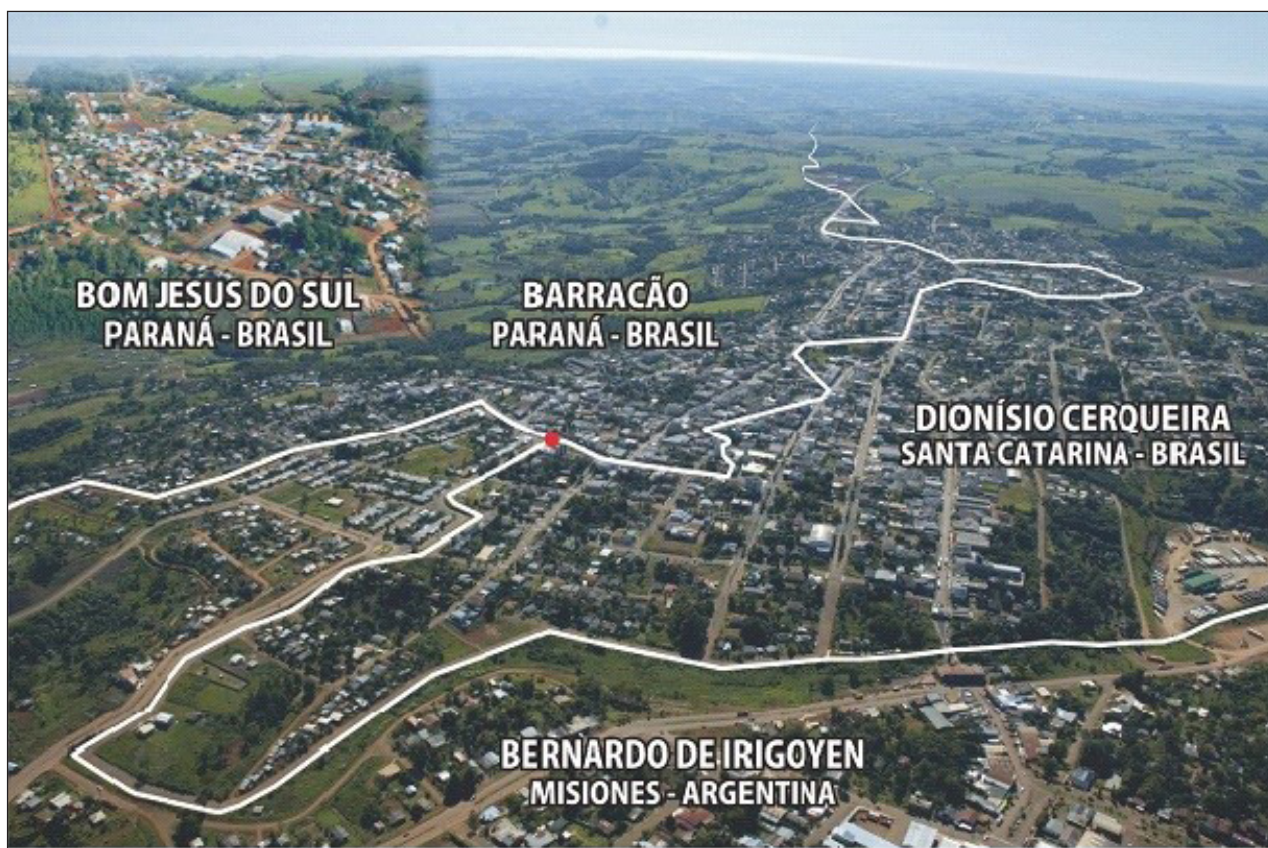
Figura 1 - Imagem aérea da fronteira

Esclarece-se, por fim, que, entre os dias 23 de dezembro de 2014 a 10 de janeiro de 2015, foi realizada pesquisa de campo, comportando análise documental e emprego de entrevista individual em profundidade, por meio de roteiro semiestruturado, realizada com prefeitos e ex-prefeitos dos quatro municípios que participaram do processo de constituição do consórcio (mandatos 2009-2012 e 2013-2016, resultando em seis entrevistados), além do Coordenador Executivo e de três representantes da sociedade civil (Ex e atual presidente da Associação Comercial e Empresarial [Ascoagrin] dos municípios de Barracão, Bom Jesus do Sul e Dionísio Cerqueira, e a Juíza da Comarca de Barracão). As entrevistas foram gravadas com o consentimento dos entrevistados e, posteriormente, transcritas para assegurar todos os detalhes para a análise de conteúdo. A síntese dos aspectos metodológicos se apresenta no quadro 1.