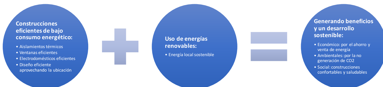
Imagen 3: Resumen del concepto PlusEnergy y sus beneficios (elaboración Javier Trespalacios)

Para lograr la aplicación del concepto PlusEnergy o PlusEnergy-House y lograr un balance energético positivo anual, las construcciones de Disch hacen el mejor uso activo y pasivo del lugar, utilizando la energía más abundante gratuita, capturando el calor del sol durante el día por medio de grandes acristalados o ventanas ubicadas en dirección al sol, esto permite utilizar menos los sistemas de generación de calor durante el día y la noche, pero también permite que entre luz solar natural en lugar de utilizar bombillas. Disch utiliza ventanas que tienen cristales con triple panel, los cuales no permiten que el calor que entra salga; en las zonas opuestas al sol utiliza aislamientos térmicos, lo que permite un ahorro en la producción de energía para calentar. Los techos son sistemas fotovoltaicos que generan electricidad y sirven también para proteger la construcción del sol durante el verano.