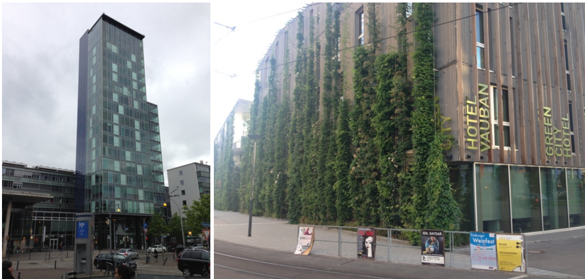
Imagen 1: Torre solar en la estación central 3 , Hotel Green City Vauban 4 - Friburgo, Alemania

Friburgo de Brisgovia (en alemán Freiburg im Breisgau) es una ciudad con 220'000 habitantes en la región alemana más soleada. En esta ciudad considerada una Green City tienen sede organizaciones relacionadas con la sostenibilidad como la Sociedad Internacional de Energía Solar (en inglés ISES, International Solar Energy Society 1 ), también la ciudad tiene un fuerte trabajo por la transición energética 2 , políticas medioambientales y el uso de energías renovables, que han hecho considerarla a nivel mundial como una ciudad verde o con mayor precisión llamarla Freiburg Green City [2].