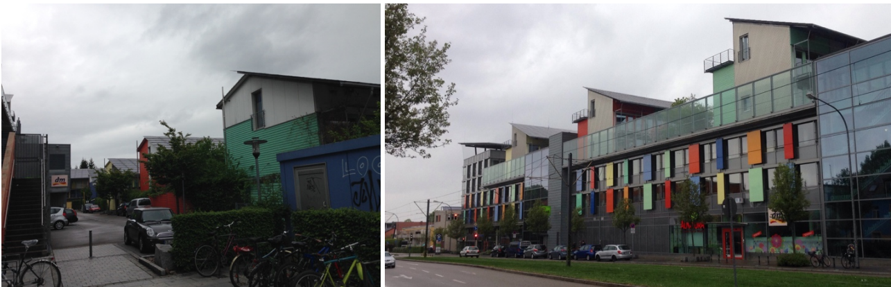
Imagen 2: Barrio solar en Schlierberg, Barco Solar (Sonnenschiff) - Friburgo, Alemania

Disch llamado el “Arquitecto Solar” comienza en 1993 a realizar proyectos con la utilización eficiente del sol en el estadio del Sport-Club Freiburg, el cual fue el primero con energía solar fotovoltaica en Alemania; otro de sus proyectos insignia es el barrio Solar en Schlierberg (en alemán Solarsiedlung am Schlierberg), el cual consta con 59 edificaciones construidas con madera, materiales de construcción sostenibles, y sus techos con módulos fotovoltaicos; el principal edificio en este barrio ubicado en la zona de Vauban es el Barco Solar (en alemán Sonnenschiff). Este barrio lleva la aplicación del concepto de PlusEnergy creado por Disch [3] pero a una escala comunitaria (ver imagen 2).